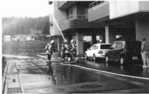
消防署消火訓練放水