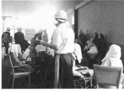
三好園しんぎ避難完了