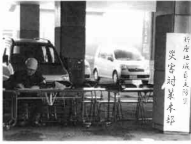
災害対策本部設置

又関連した組長さんはじめ大勢の役員さんご苦労さまでした。万々に備えてしっかりと覚えておきましょう。