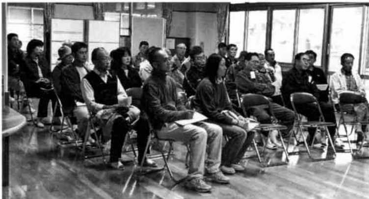
三好園しんぎの職員の方も参加頂きました