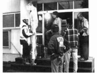
七和会館発電機動作中