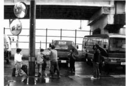
本町七丁目避難風景