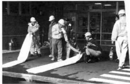
模擬消火訓練指導中